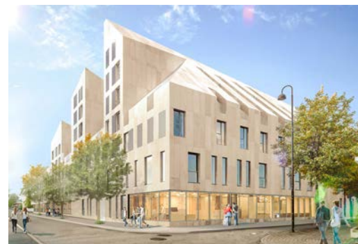
Campus Galène, BORDEAUX